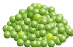
170 g Erbsen 10 g Ballaststoffe

10 g Ballaststoffe sind zum Beispiel in 100 g Haferflocken, aber auch in 170 g Erbsen enthalten. Durch diese Entsprechungen können wir uns abwechslungsreich ernähren, zugleich unseren Körper mit allen wichtigen Elementen versorgen und Mahlzeiten mit unterschiedlichen Geschmacksrichtungen zu uns nehmen.