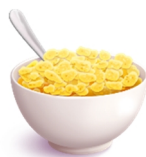
100 g Haferflocken 10 g Ballaststoffe

Lebensmittel-Alternativen können zur gleichen Lebensmittelgruppe gehören, aber es gibt auch Alternativen zwischen unterschiedlichen Gruppen.